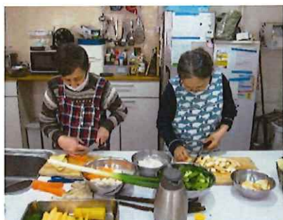
料理はお手のもの

自分の役割を持ちたい、という利用者の気持ちに寄り添いながら、「今この場でやれること」は多くあり、外出の時に車いすを押す、みんなが食べた食器を片付ける、心地よいメロディーを得意のキーボードで演奏するなど、ひとりひとりが主役となれる場を多く作ってきた。