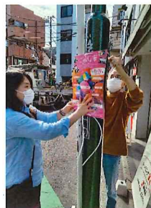
《ポスター貼りも仕事》

多くの利用者が希望される就労に向けて、柔軟なプログラムを利用者と一緒で作成し、短い期間で見直しを繰り返した成果から今年度は様々な形の就労の成果を得ることができた。このことは、日常的に、当事者の希望に沿いながら、ハローワーク、就労移行支援事業所、元職場、医療機関、就労支援センターなどと細かな連携を取り繋がりを作る作業に重点を置き、並行して、利用当事者の意思決定を常に語りあえる時間を作った成果と考える。