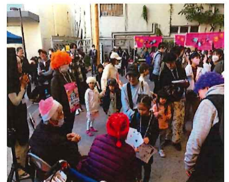
<ごきんじょ市にデイサービス利用の方がボランティア参加>