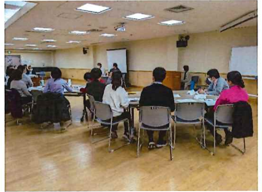
<話す会：障害のある方が登壇し自身の思いを語った>

タイトル：「ほっ」とできて、話せる、笑える「よりどころ」一緒に考えませんか？（30名参加）