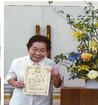
令和5年度 世田谷区介護従事者等合同入職式・永年勤続表彰式記念 令和5年6月29日 世田谷区

年を重ねても「誰かの役に立ちたい」「自分のためにも働いていたい」と使命を持つヘルパーは多く、事業所としてヘルパーと「やりがい」を共有することができたと思っている。