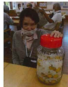
いただいた大量の梅を使って梅ジュースを作成