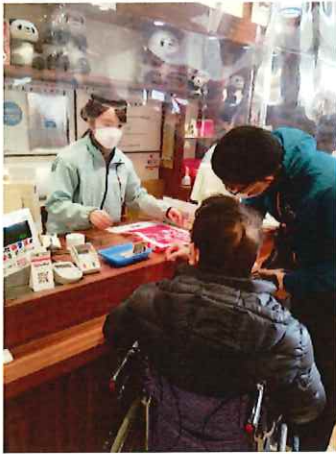
横浜中華街でお土産購入