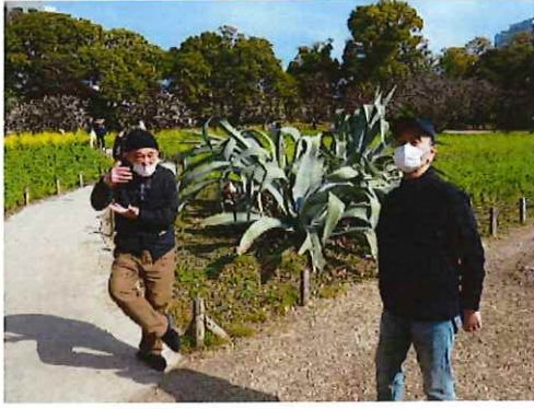
浜離宮恩賜公園にて足場が悪くても頑張って歩きます