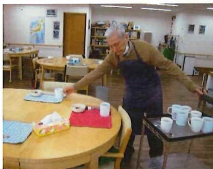
家では見せない姿なんです